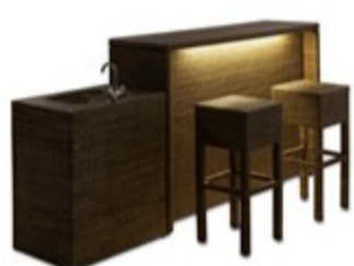
ストレートタイプ

※トランスには照度センサー（日没～予約）とタイマー（4・6・8時間）が付いています。 ※照明全体をOFFにする場合はトランスのスイッチを切ってください。